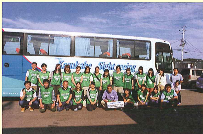
2013/6/23 福島県いわき市仮設住宅にて