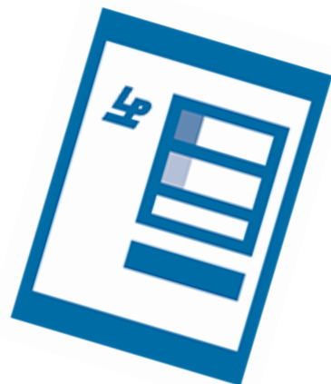
〔返信用レターパック〕